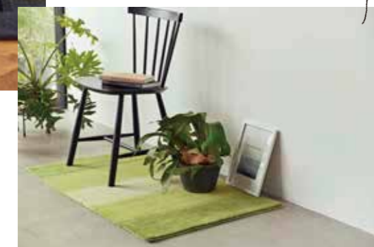
植物を置いたら緑色が合います！