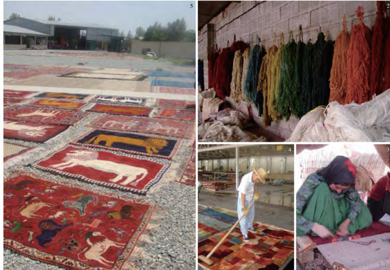
1 ギャッベと呼ばれる毛足の長いじゅうたんは、イラン南西部に連なるザクロス山脈一帯で暮らす、カシュガイ族などの遊牧民の女性たちが先祖代々織り続けています。2 寒暖の差が激しい高地で育つ、上質な羊の毛を紡いだ糸は草木染めに。3 遊牧民の若い女性たちは母から織る技術を受け継ぎ、自由な感性で創り上げます。4 織り上がったギャッベは洗うほど色が冴えて。5 仕上げは天日で自然乾燥に。

イランの大自然を旅して暮らす遊牧民の女性たちは、テントに敷くじゅうたんの通か昔から織り続けてきたのだそうです。結婚が決まると、嫁入り支度で、初めてのじゅうたんの織るのが好きです。その文様や図案にはお手本がなく、織り手が家族の幸せや故郷の風景に思いを寄せながら、自由に織るのだとか。このじゅうたんの中でも、最も上質な羊毛を使い、技術と感性のすぐれた織り手が創り上げたものだけを「アートギャッベ」と呼ぶのです。